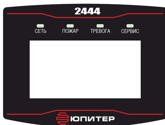
Рисунок 3. Внешний вид панели индикации

На лицевой панели прибора расположены жидкокристаллический дисплей и светодиодные индикаторы (рисунок 3), режимы работы светодиодных индикаторов описаны в таблице 2.