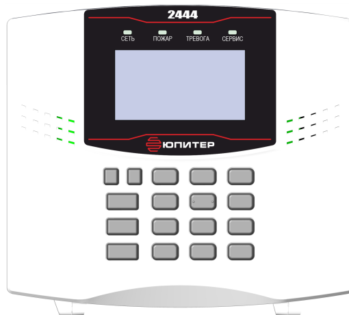
Рисунок 1. Внешний вид прибора

Прибор изготовлен в пластмассовом корпусе, на его передней панели расположены кнопки управления, жидкокристаллический дисплей и четыре светодиодных индикатора (рисунок 1).