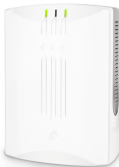
Рисунок 1 – Внешний вид изделия

Изделие предназначено для питания постоянным электрическим током средств пожарно-охранной сигнализации, устройств промышленного и бытового назначения, требующих при эксплуатации бесперебойного питания. Изделие рассчитано на непрерывную круглосуточную работу. Внешний вид изделия приведен на рисунке 1.