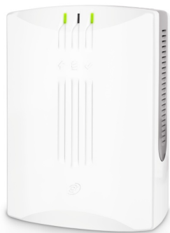
Рисунок 1 – Внешний вид изделия

Изделие предназначено для питания постоянным электрическим током средств пожарно-охранной сигнализации, устройств промышленного и бытового назначения, требующих при эксплуатации бесперебойного питания. Изделие рассчитано на непрерывную круглосуточную работу. Внешний вид изделия приведен на рисунке 1.