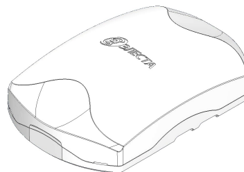
Рисунок 1. Внешний вид прибора

Прибор изготовлен в пластмассовом корпусе (рисунок 1).